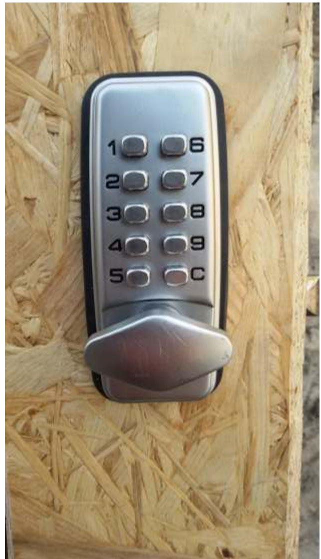
Geländesicherung, Metaltor mit Zahlenschloss für Zugang der Solawi (Depotnutzung)