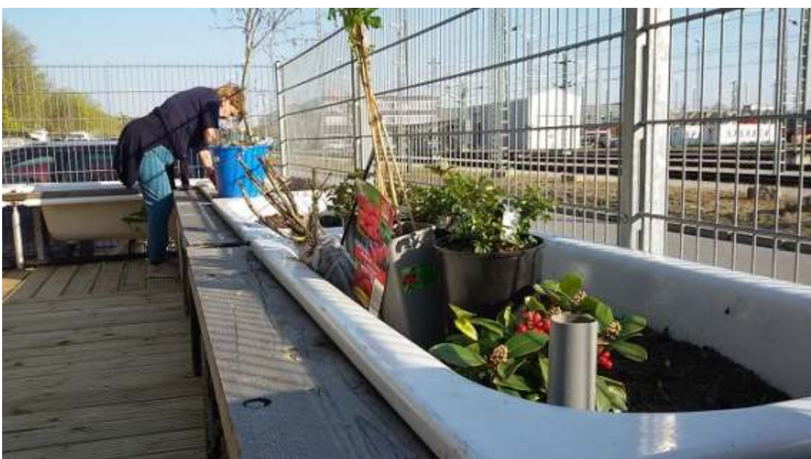
Bau des Umlaufs und Bepflanzung der Wannenburg